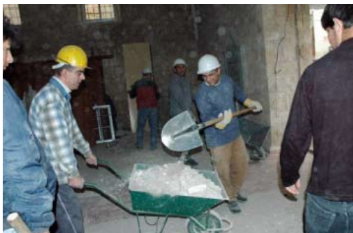
Insieme per la ricostruzione (verniani, fratelli missionari e giovani di yarun...)