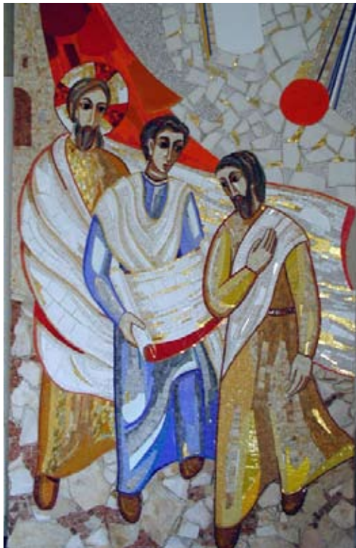
Gesù sulla strada di Emmaus

magari fanno ricorso a manipolazioni della verità, perché vale sempre il machiavellico "il fine giustifica i mezzi"; oppure creare allarme sociale o usare le persone e le loro storie sul teatrino della tv; oppure tentare di rafforzare la propria parte politica usando i valori come armi da lanciare contro gli avversari, in coincidenza di tornate elettorali; oppure, peggio ancora, ricorrendo al delitto come si usa fare nei paesi dell'Oriente dilaniati da queste guerre tra gli eserciti e i terroristi, dove i civili sono gli unici